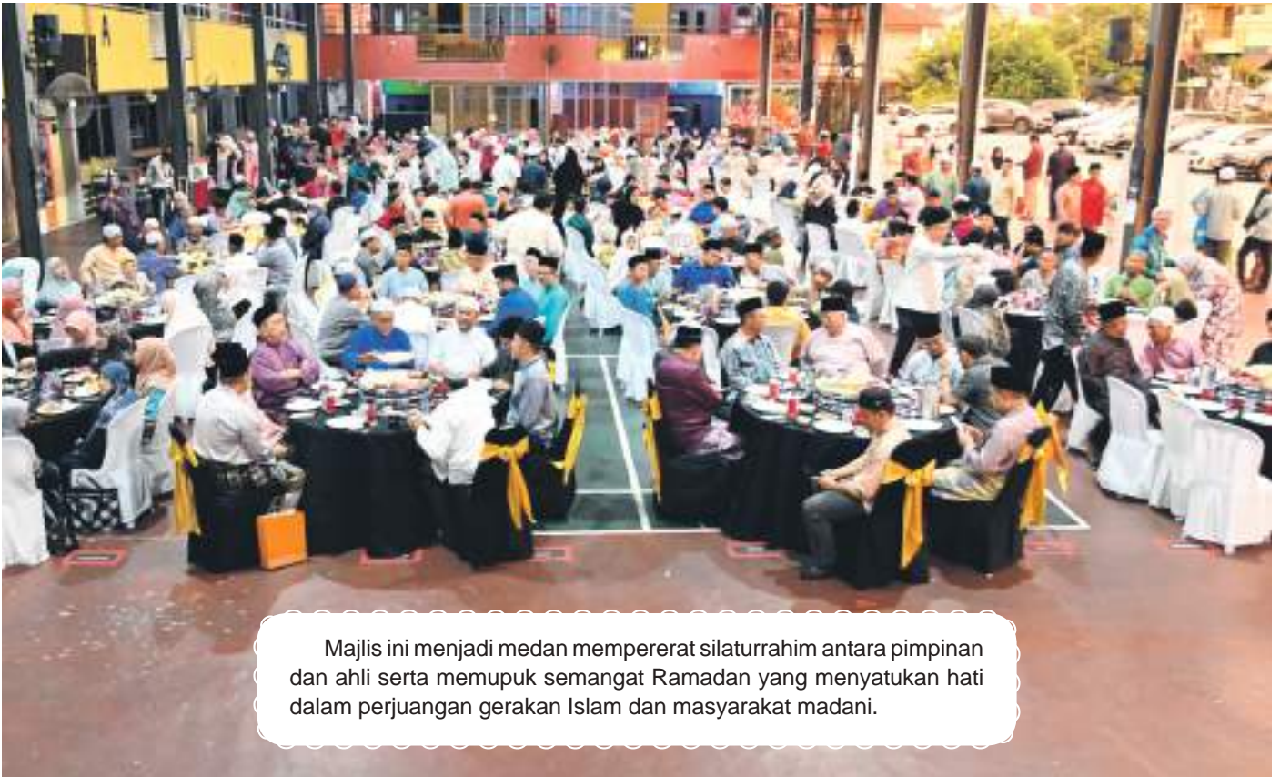
Majlis ini menjadi medan mempererat silaturrahim antara pimpinan dan ahli serta memupuk semangat Ramadan yang menyatukan hati dalam perjuangan gerakan Islam dan masyarakat madani.