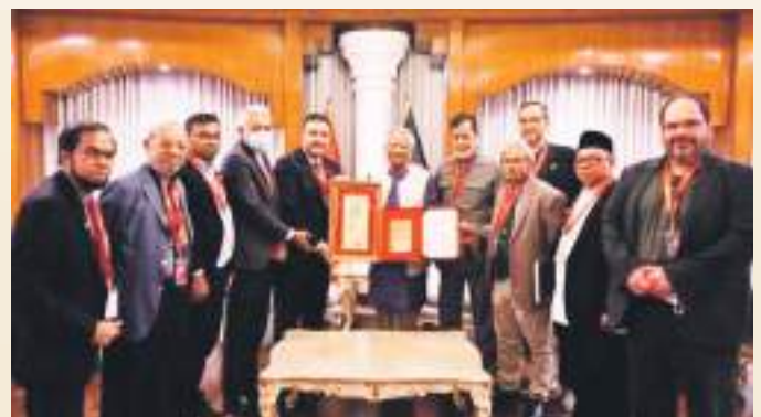
➤ Pertemuan pimpinan utama UNIW bersama Perdana Menteri interim Bangladesh.