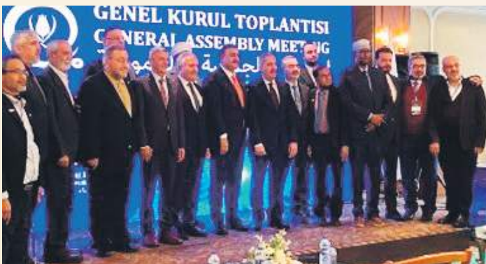
➤ Datuk Bandar Istanbul memberi ucapan perasmian dan sesi fotografi bersama tetamu kehormat.